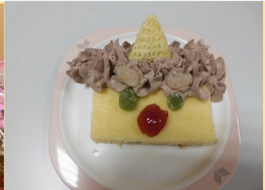
デイサービスセンター：鬼ケーキ！

百寿の誕生日会を開催しました。お祝いカラーが百（もも色）なので誕生日会の飾りもピンクと白を基調に飾り付けしご本人に選んでもらいお花の冠をかぶり、楽しい誕生会になりました。